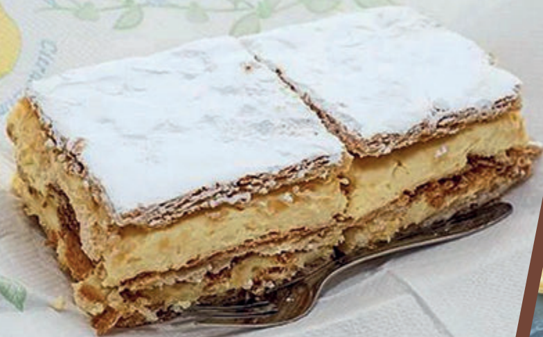
PLANCHA MILHOJAS CREMA