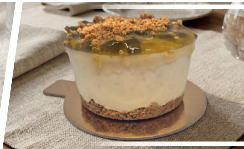
CHEESECAKE MANZANA SMITH