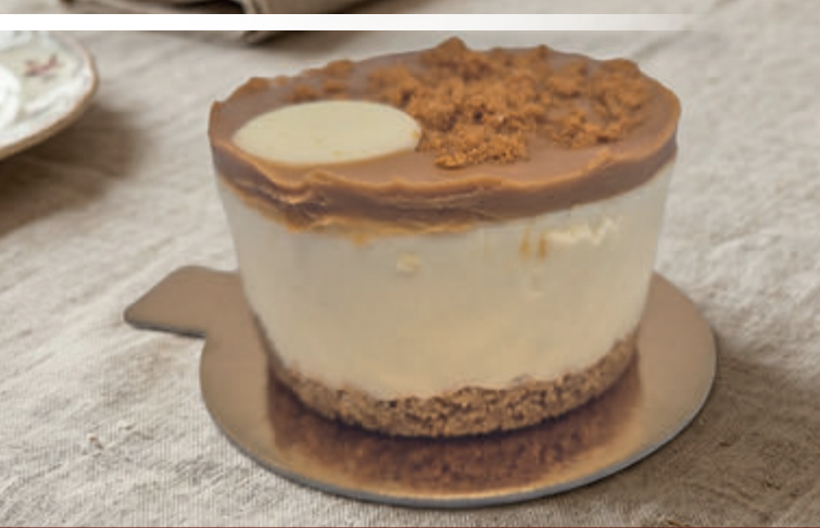
CHEESECAKE GALLETA LOTUS