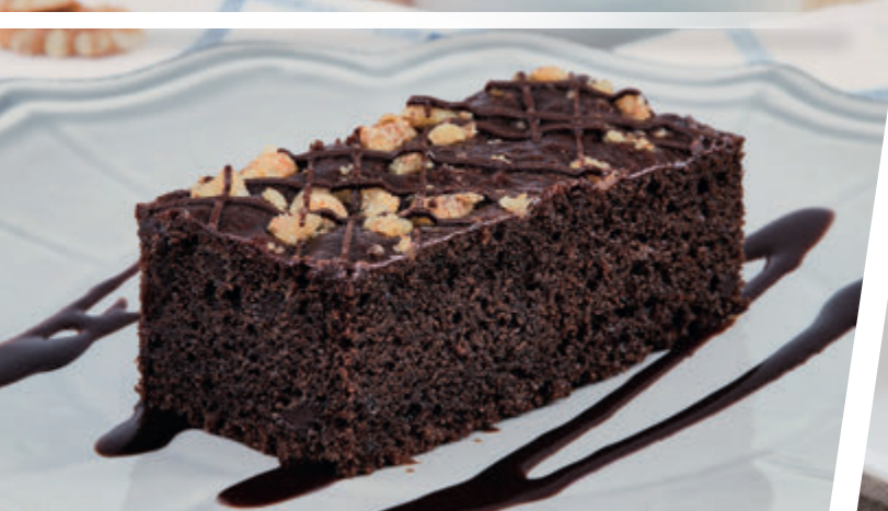
BROWINE CON NUECES