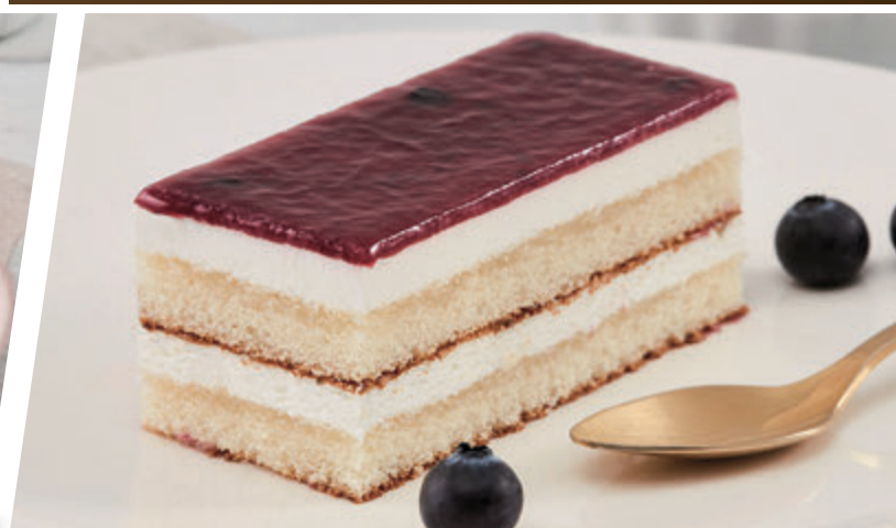
QUESO CON ARÁNDANOS