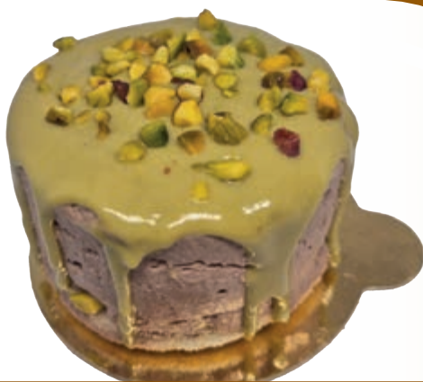
AMADEUS • CHOCOLATE • PISTACHO