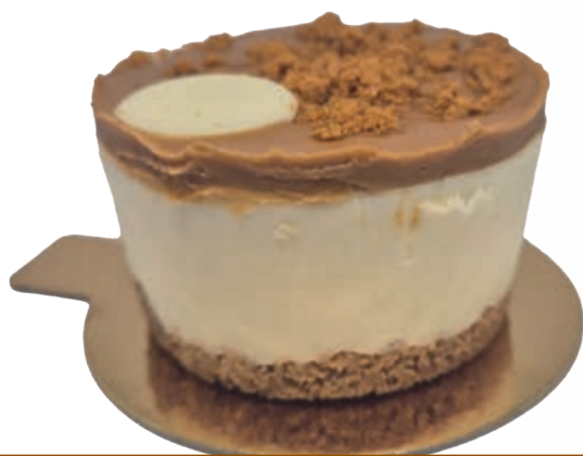
CHEESECAKE GALLETA LOTUS