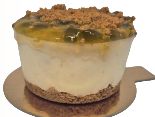
CHEESECAKE MANZANA SMITH